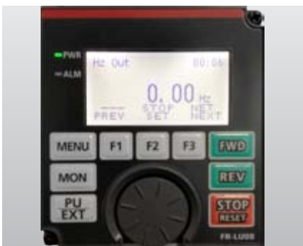
FR-LU08 с полнотекстовой индикацией на максимум пятнадцати языках и часами реального времени.

С помощью поворотного диска, встроенного в пульт, пользователь получает непосредственный доступ ко всем важным параметрам. Вы можете самостоятельно выбрать тип пульта, наилучшим образом